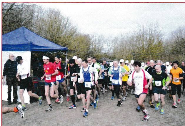
C'est parti pour six heures

" Côté organisation, pas de faille: bénévoles au ravitaillement aux petits soins pour les coureurs, encouragements pour chacun à chaque passage devant la zone chronos ", avait conclu Laurence Noël qui a parcouru 72 km le 24 mars 2019.