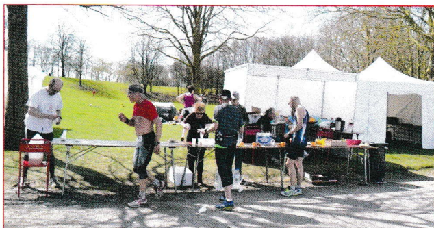
La zone de ravitaillement

Le parcours se situe dans le parc urbain de Loos et mesure 1 559.65 m. Il est très plat, bordé de belles pelouses et de zones de jeux pour enfants.